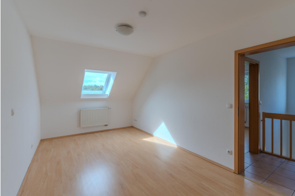
Gemütlich und ruhig!