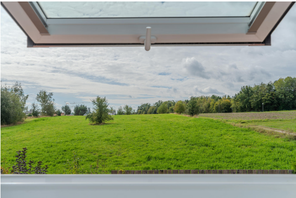
Charmantes Badezimmer im DG!