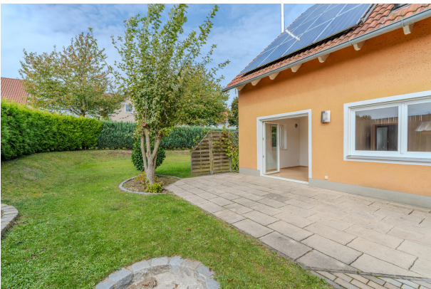
Hier wird Garten noch großgeschrieben!