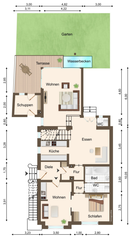
Grundriss 1. Obergeschoss