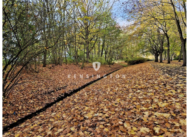
Grünanlage am Kraatz-Tränke-Graben