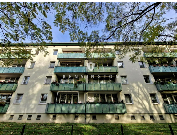
Wohnhaus Südansicht I